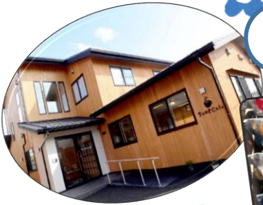
社会福祉法人 あすか会