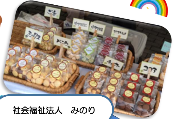
社会福祉法人 みのり