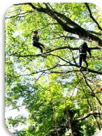
自然学校「ツリーイング」

そこで適正な勤務にむけ、週1回の定時退勤や業務の改善、行事の見直し等の取組に、本年度もご理解をお願いします。