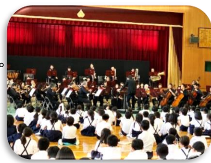
関西フィルハーモニー管弦楽団

10月13日(火)文化庁の事業、「文化芸術による子供育成総合事業(巡回公演事業)」により、関西フィルハーモニー管弦楽団が来校され、本校の体育館で生の演奏を披露してくださいました。午前と午後に分けて2回の公演をしてくださったので、全校児童が鑑賞することができました。プロの演奏家の優れた音楽と出会い、演奏に引き込まれていく子どもたちを見て、この会の意義と本物との出会いの大切さを改めて実感しました。間違いなく子どもたちの感性は高まりました。感染防止対策を十分に取られて公演を実現させてくださった関係の皆様へ感謝。さて11月に入るとマラソン大会、そしてそれに向けた駆け足が始まります。本年度はこれも感染症防止対策の為、中間休みの5分間走を1・3・5年と2・4・6年と学年を分けて1日おきに実施します。ご支援よろしくお願い致します。