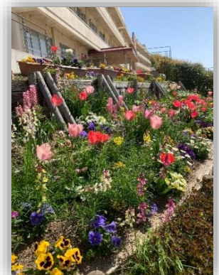
花っ子の活動で 整備されている花壇