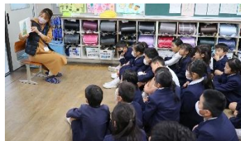
本の読み聞かせ活動