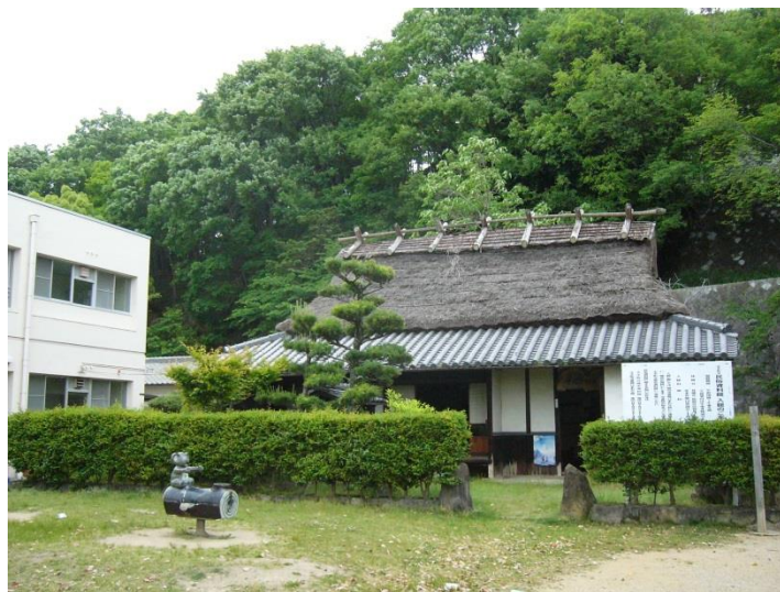
民俗資料館(旧尾野家住宅)