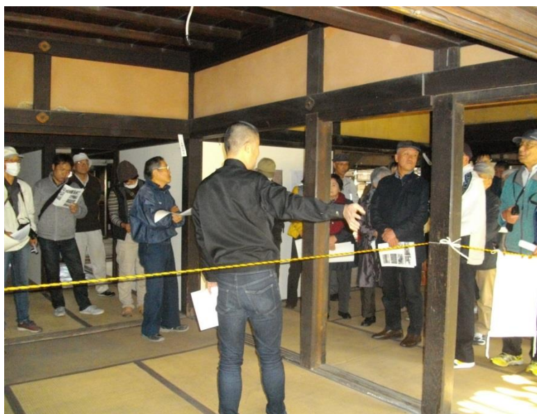
平成29年度現地説明会の様子