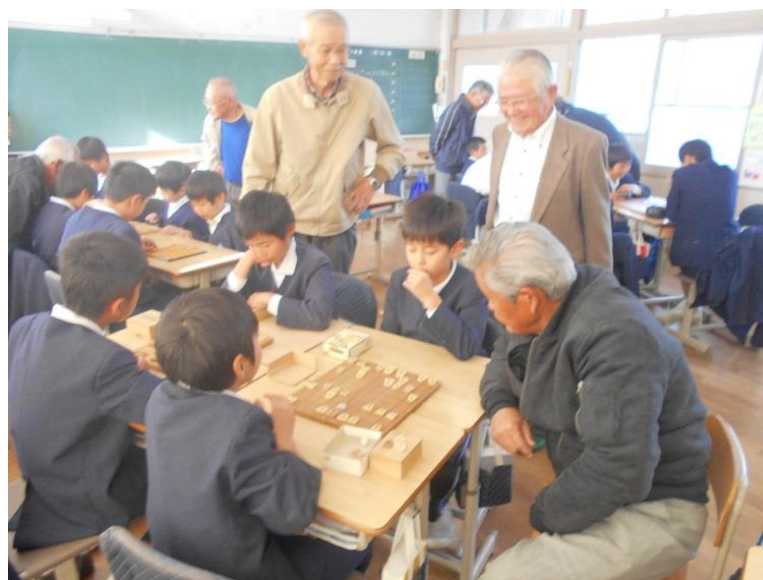
平成29年度 おじいちゃんおばあちゃんと遊ぼう会(将棋)