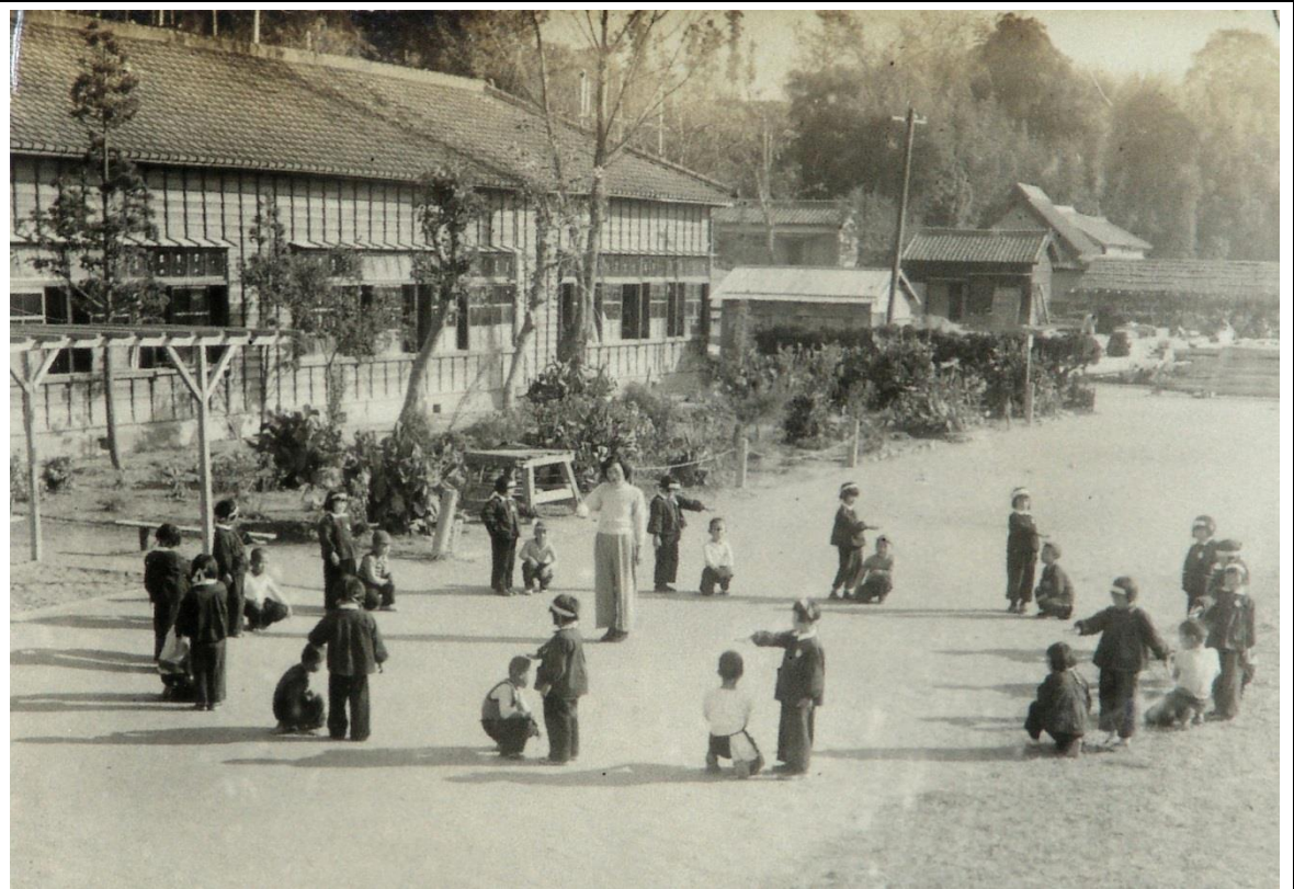
校庭で遊ぶ児童 太田小学校 1952年