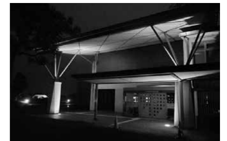
▲保健福祉会館南側