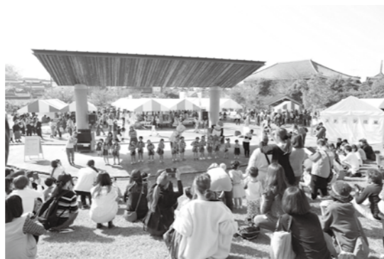
▲過去のふれあい TAISHI の様子