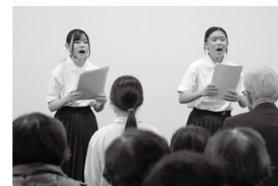
どんぐり劇場 「トライやる朗読劇」