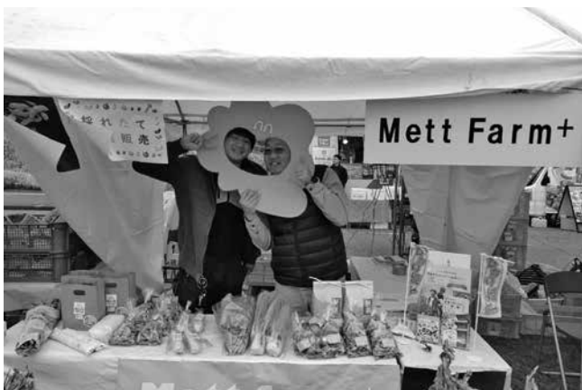
▲ Taishi Mett Farm+ での活動の様子（イベント出店）

議長 皆さんのお話を聞き、農業の未来を真剣に考えてくださっていることに、本当にうれしくなりました。私自身、子どもの頃に父が汗を流して農作業をする姿を見て、『カッコいいな』と憧れた記憶があります。そうした体験や思い出が、農業の魅力を伝える力になると思います。今は、家族で田植えや稲刈りをする機会が減っていますが、だからこそ、子どもや若い世代が農業に触れられる場を広げることが大切です。議会としても、皆さんのアイデアを行政につなぎ、企業や地域と協力