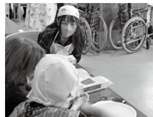
（福）太子福祉会 太子の郷