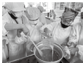
▲いちじくジャムも作ります