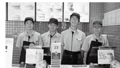
マクドナルド姫路太子町店