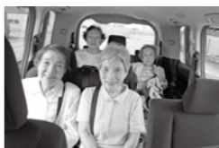
車内の会話も楽しみのひとつです。

②集合場所に到着後、利用者は運転ボランティアが運転する買物支援事業用の公用車に乗ってスーパーなどへ向かいます。行き先は利用者同士で話し合います。買物慣れた場所に行くこともあれば、住んでいる自治会から遠い場所に行くこともあります。