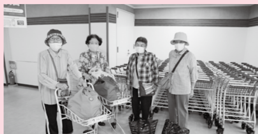
田中自治会で利用している皆さん

毎週1回決まった曜日で運行してもらえるので、知らない間に習慣付き、予定も立てやすくなりました。買物物に行ける楽しさと、皆さんと会話できる楽しさがあり、大変うれしく思います。