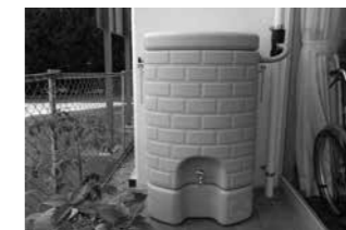
※画像は斑鳩公民館の雨水タンクです