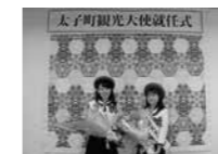
第2回太子町観光大使就任式