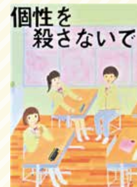
太子東中2年 花野 有海