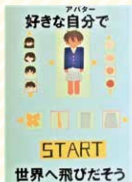
太子高校3年 山本 心緒