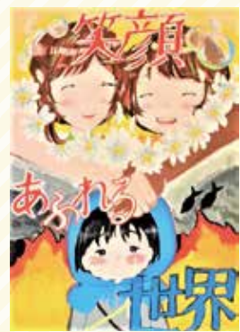
太子西中1年 塚本 彩乃