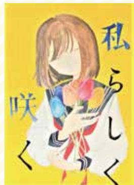
太子東中3年 中前 七海