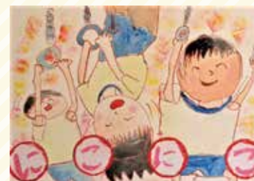
龍田小2年 森脇 鈴