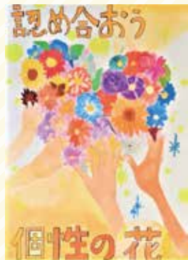
太子東中3年 高見 希望