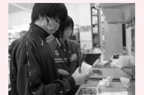
セブン-イレブン兵庫太子佐用岡店