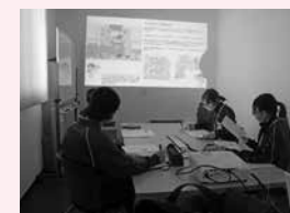
高井医療器株式会社