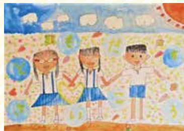
石海小4年 中山 詩菜