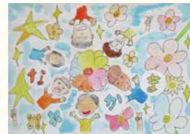
太田小4年 江見 徠夢