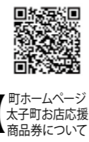
町ホームページ 太子町お店応援商品券について