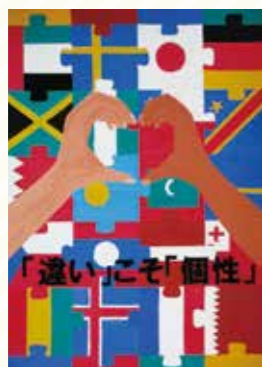
太子高3年 北谷 陽菜