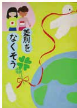
太子東中1年 花野 有海