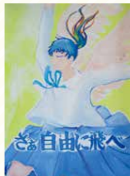
太子西中2年 森川 愛奏