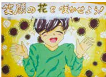
太子西中1年 高瀬 寛人