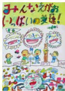
石海小4年 西村 羽琉