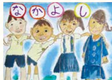
龍田小3年 山本 綺華