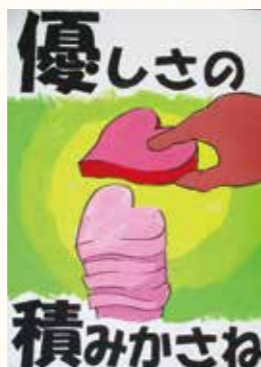
太子東中2年 大西 晴奈