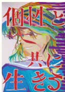
太子西中3年 高橋 未奈