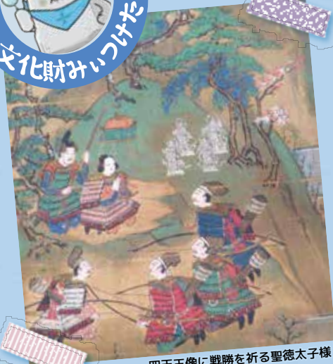
四天王像に戦勝を祈る聖徳太子様

これは、聖徳太子様の一生のいろいろな場面を、春夏秋冬の4幅の掛け軸に散りばめた絵だよ。年代順ではなく、その出来事のあった季節ごとに、花や紅葉、雪などの風物と一緒に描いているんだ。赤い着物が太子様。幼い太子様が凛々しい若者になり、威厳のある大人になっていく様子もよくわかるよ。