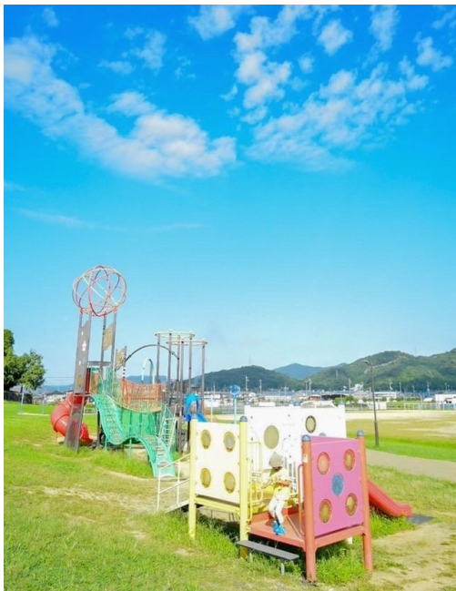
〈上：遊具広場〉

総合公園には、遊具広場も整備しています。特に、大型複合遊具は子どもたちに大人気です。また、総合公園に隣接している子育て支援センター「ひまはび」は、子育て親子の交流の場になっています。