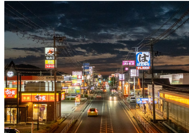
〈上：店舗が多く並ぶ国道179号〉

太子町は、南北4キロ、東西6キロのコンパクトなまちですが、スーパーやコンビニ、ドラッグストアなどが立ち並び、生活に必要なものが揃う便利なまちです。