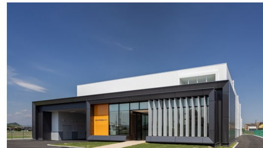
〈右：学校給食の様子〉