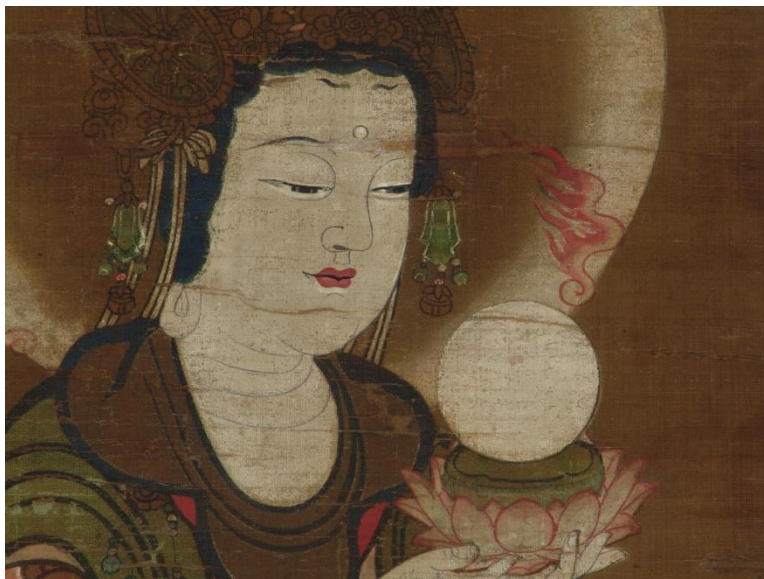
「十二天画像」のうち月天