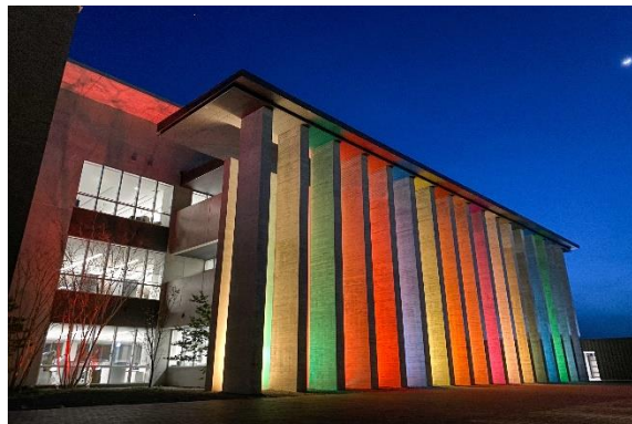
過去のライトアップの様子