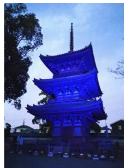
過去のライトアップの様子