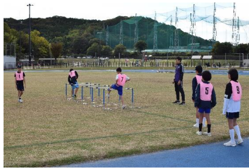
過去の太子町マラソン教室の様子