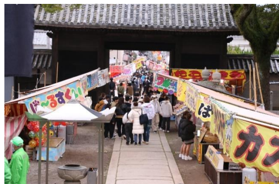
過去の春会式の様子