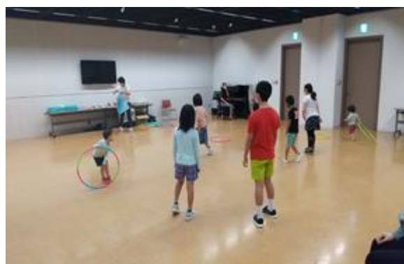
手をつなぐ育成会実施の様子