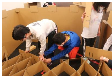
過去の町防災訓練の様子