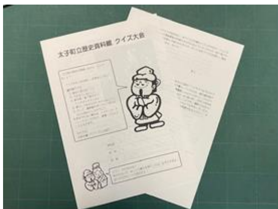
過去のクイズ用紙