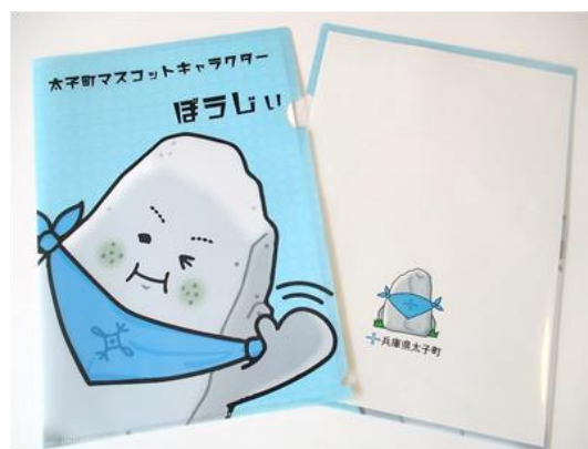
ぼうじいクリアファイル