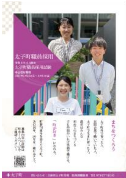
令和3年度パンフレット