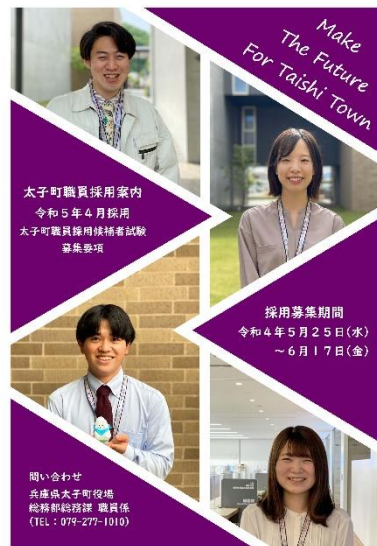
令和4年度パンフレット