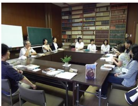
第1回目の様子（平成28年度）