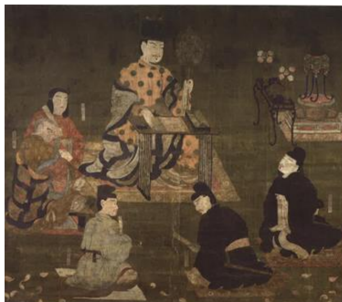
国指定重要文化財「聖徳太子勝鬘経講讃図」