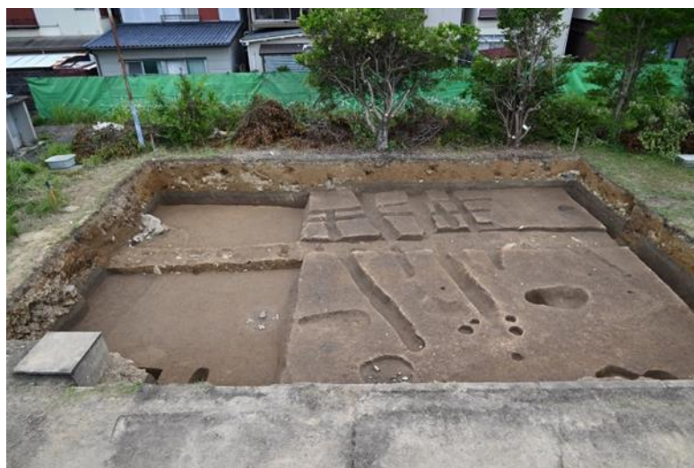
吉福西遺跡の調査の様子