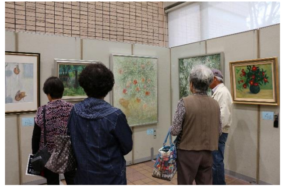
前回（第61回 太子町公募美術展）の様子