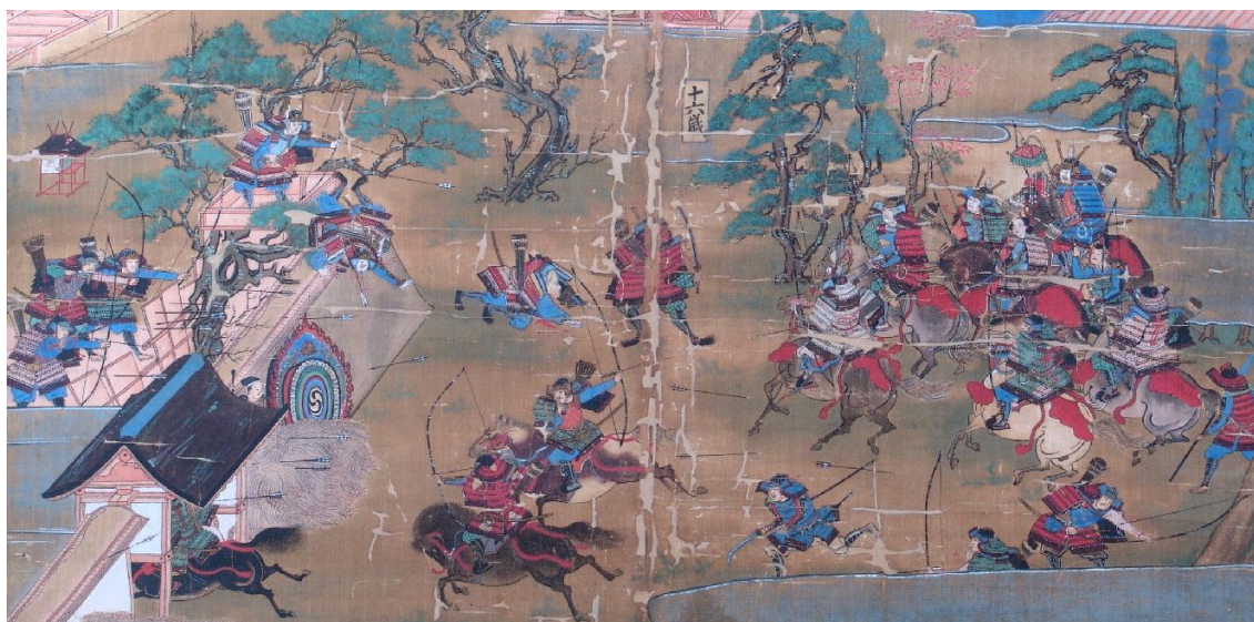
聖徳太子絵伝（斑鳩寺蔵）より、太子と物部守屋との合戦の様子