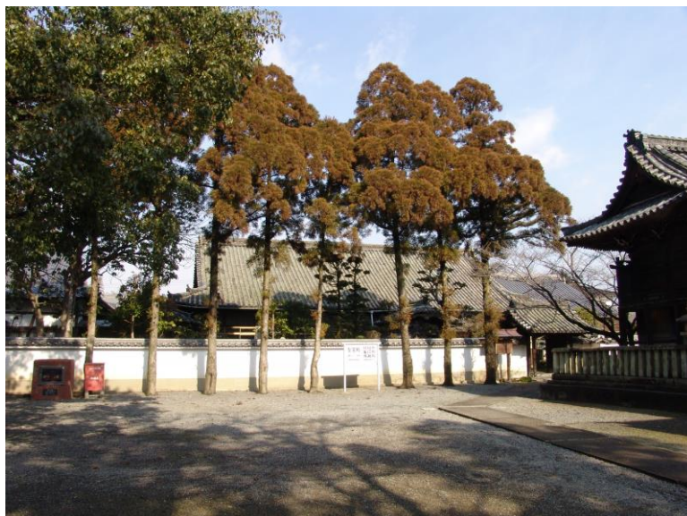
斑鳩寺の庫裏（修理前）