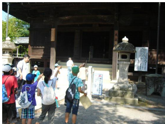
斑鳩地区での歴史探検隊の様子