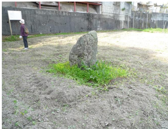
聖徳太子の投げ石（鶺鴒北山根）