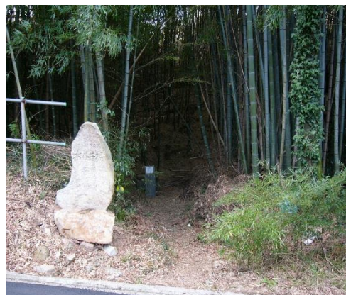
当日見学する「桜井の清水」