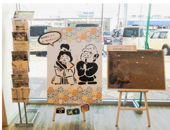
【参考】まち PR ブースイメージ（ユニクロ太子店内）