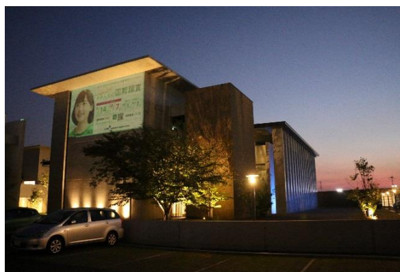
ライトアップ及び壁面投影イメージ（ブルーライト・R2 国勢調査啓発時）