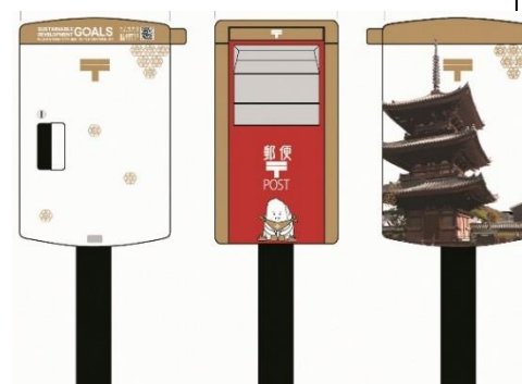
【デザインイメージ】

■設置箇所 庁舎南入口前・鶴バス停前・太子バス停前・太子郵便局前・太子西中学校前・沖代簡易郵便局前・福地簡易郵便局前・マルアイ太子店前・太子太田郵便局前・佐用岡簡易郵便局前