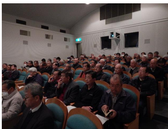
平成30年度講演会の様子