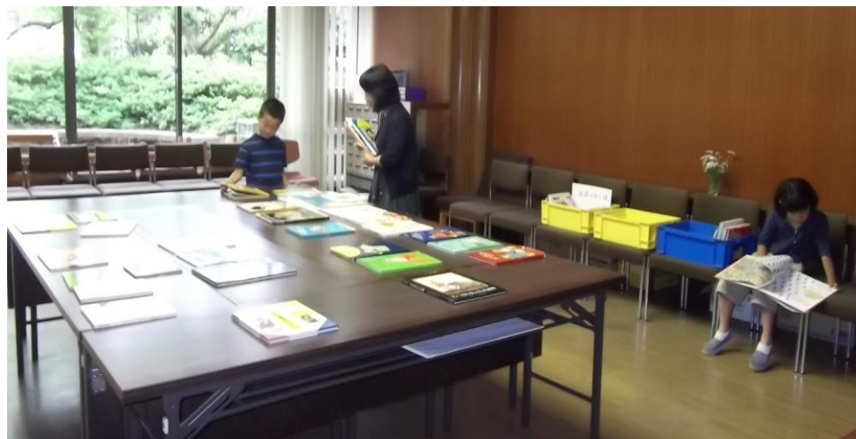
（昨年の絵本の交換会の様子 28年6月）