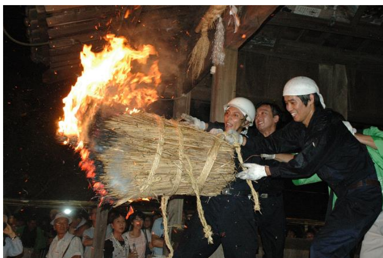
「囃しことばから、雨乞いと強い関係がうかがえる原の松明」