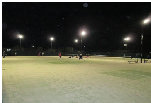
ナイター設備が整備されたテニスコート