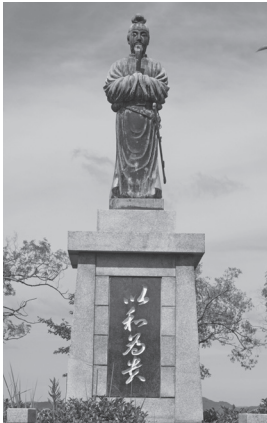
太子山公園の聖徳太子銅像

太子山公園にある聖徳太子の銅像を用いて、「太子が見つめる太子町」とPRするのも一つの手です。町外だけでなく町内の人にも太子町を好きになつてもらおうよう努めます。