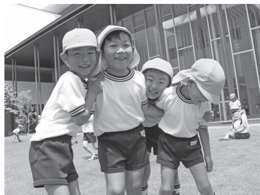
年少人口（15歳未満）割合が兵庫県内1位の太子町

町長 そのように思ってくれていてとてもうれしいです。太子町は兵庫県内の41市町ある中で年少人口（15歳未満）割合が一番高い町です。若い世代が多く、伝統文化も息つき、自然と市街地が両方存在します。このまちのいいところを伸ばせるように今後も取り組んでいきます。