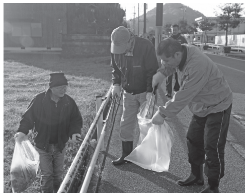
全町クリーン作戦の様子

今日は皆さんの若い力に元気を分けてもらいました。いただいたご意見をこれからのまちづくりに生かしていきます。 町長 従来の感覚や発想だけでなく創造性のあるものが評価される時代です。若い皆さんにはたくさんチャレンジしてもらい、そういったものを生み出していただければ願っています。