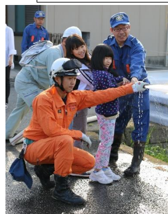
令和元年度の様子