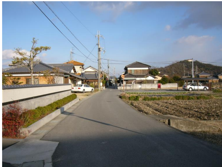
太子町阿曾、茶屋垣内の地藏堂と一里塚の跡