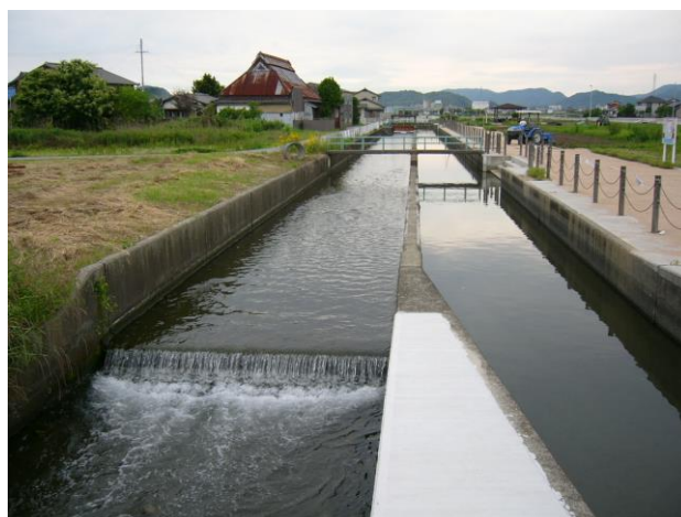
たつの市龍野町上沖の大堰

参加ご希望の方は、事前に、太子町立歴史資料館まで、お申し込みください(電話・FAX・メールでの申し込みも可)。小雨決行の予定です。