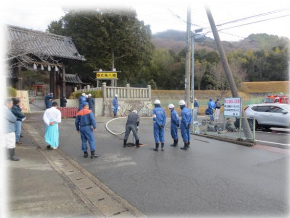
昨年の様子 （黒岡神社）