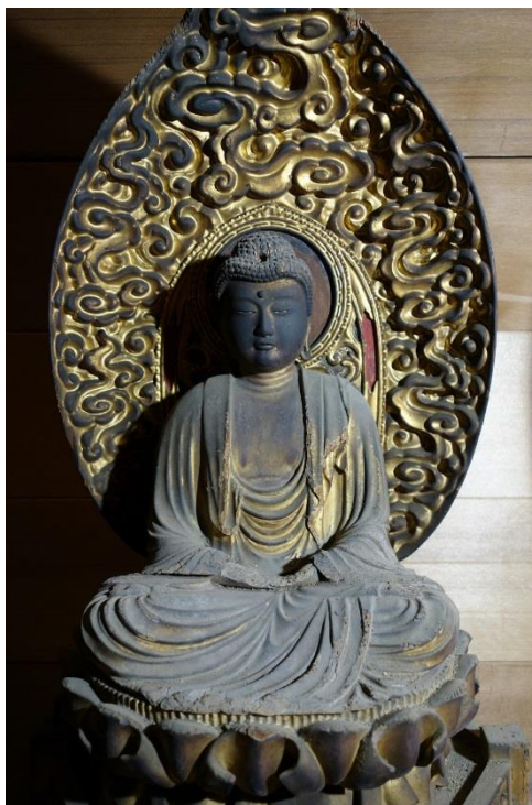
如来坐像 斑鳩寺蔵