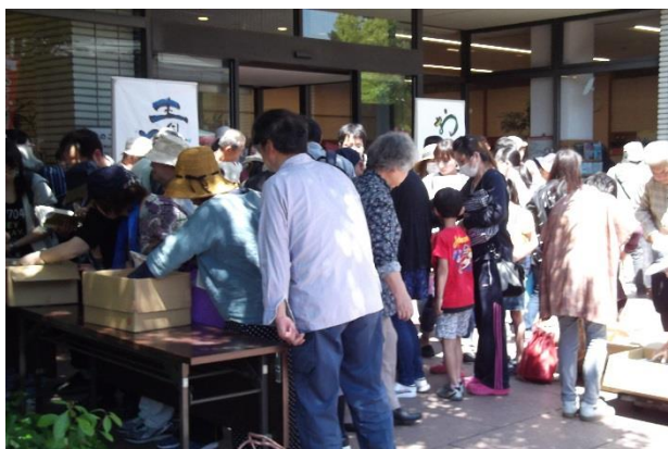
前回青空リサイクル (令和元年 5 月 11 日) の様子