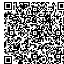
ホームページ QRコード