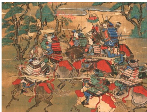
聖徳太子絵伝（天文24年・1555 斑鳩寺蔵）より、物部守屋との合戦