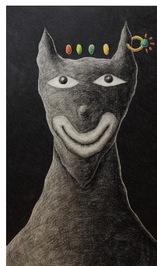
山口 謙二氏の作品