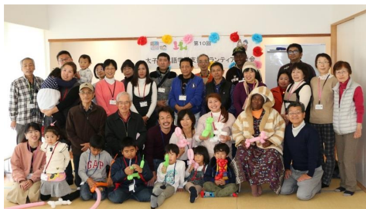
前回交流会（平成30年12月）の様子