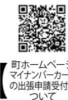
町ホームページマイナンバーカードの出張申請受付について

マイナンバーカードを自宅に郵送します。申込方法は町ホームページ内の申込フォーム、電話またはメール出張時間 平日9時～17時