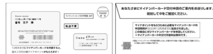
見本 「地方公共団体情報システム機構」(J-LIS) から送付

最大2万円分のポイントが貰えるマイナポイント第2弾の対象となるマイナンバーカードの申請期限は12月末までです。この機会にぜひマイナンバーカードを取得してください。