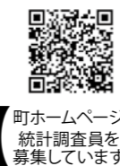
町ホームページ 統計調査員を募集しています