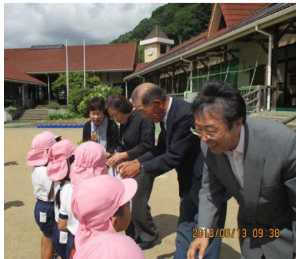
昨年度贈呈式（平成30年6月13日（水）上郡町山野里幼稚園）の様子