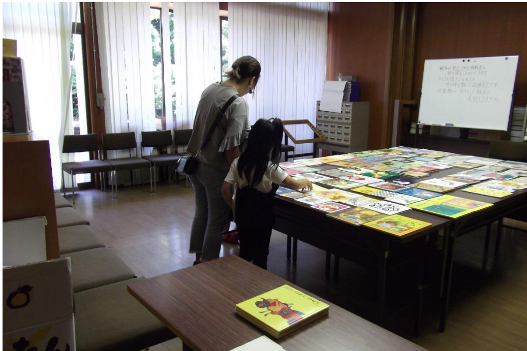
（昨年の絵本の交換会の様子 平成30年6月）