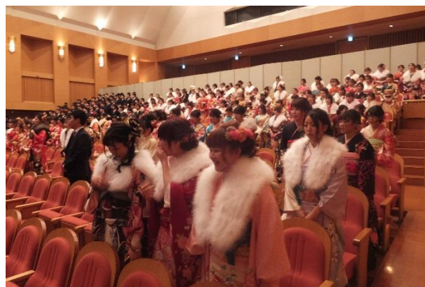
令和2年の成人式の様子