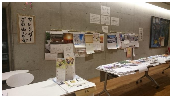
● 過去のカレンダー市の様子 ●