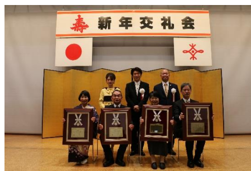
● 令和2年新年交礼会表彰式の様子 ●

会場の変更（中ホール→大ホール）、マスクの着用、アルコール消毒・サーモグラフィによる検温の実施、身体的距離の確保（1席空け等）、会場内での飲食禁止、風邪症状等がある場合の参加自粛、兵庫県新型コロナウイルス追跡システムの活用 等