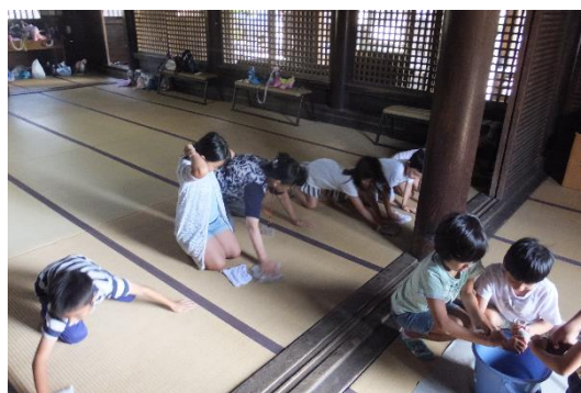
昨年度のあそびっ子教室・伝統文化教室の様子