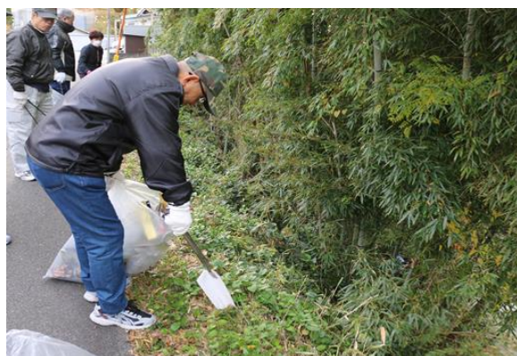
● 令和元年度 全町クリーン作戦の様子 ●