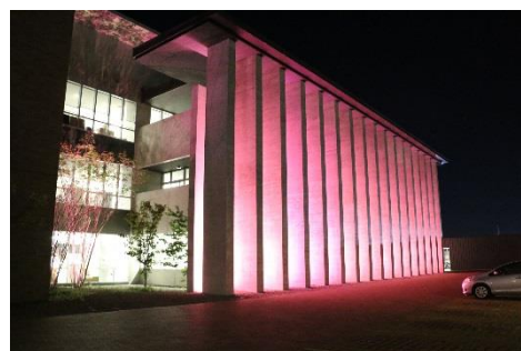
役場庁舎北側のピンクライトアップ