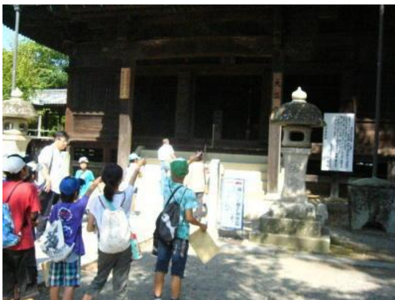
過去の歴史探検隊の様子