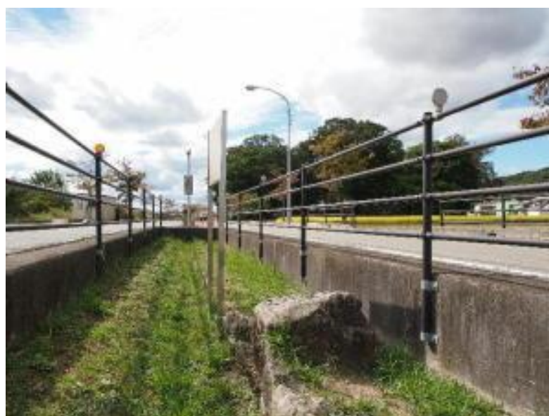
平方の投げ石の写真