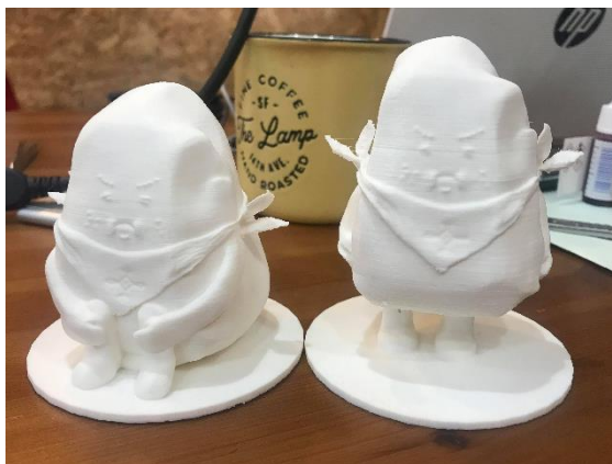
● ぼうじいフィギュア&3D ●