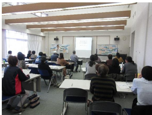
● 令和元年度 こころの健康講座の様子 ●