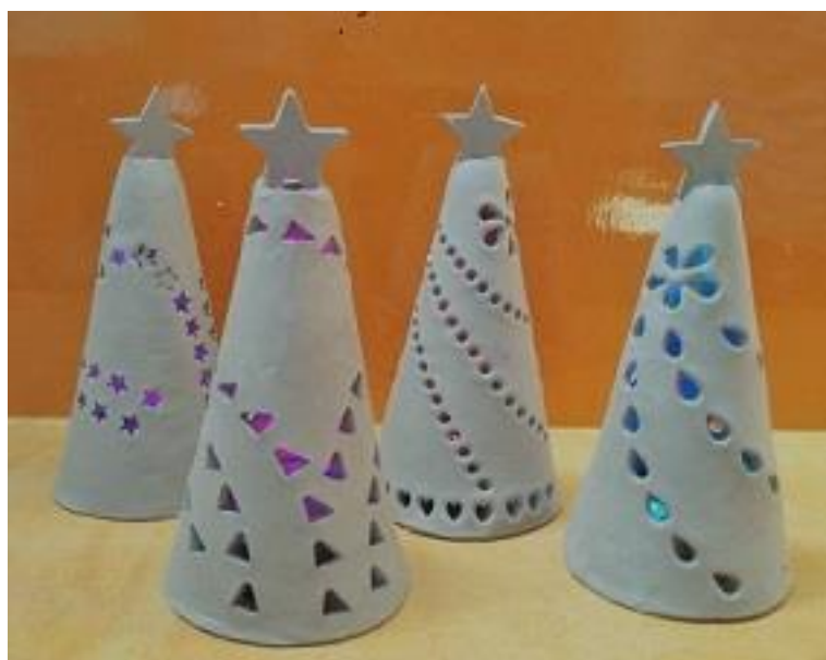
窯焼き前の状態のクリスマスツリー・ランプシェード