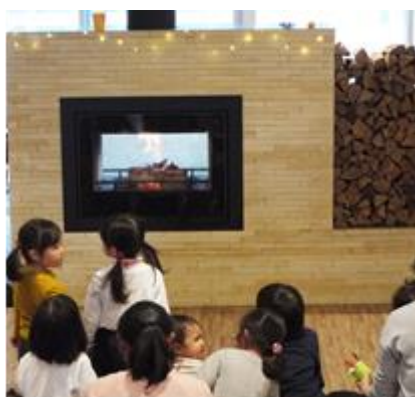
過去の着火式の様子