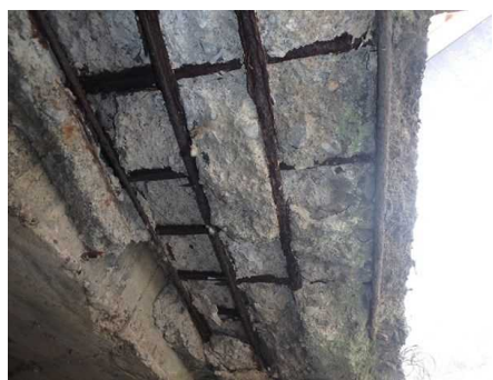
床版に剥離・鉄筋露出が見られます