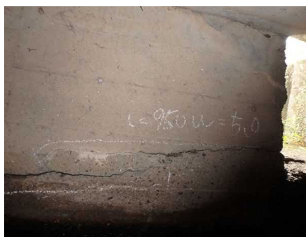
下部工にひびわれが見られます