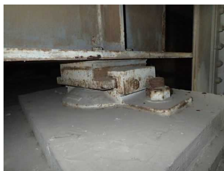
支承に腐食が見られます