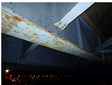
主桁に腐食が見られます