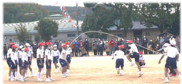
全校児童による「3分間に全集中」(大縄跳び)

コロナ禍は未だ終息しませんが、国内・県内ともに感染状況は非常に低い状況にあったので、入場はご家族限定とはさせていただきますが、人数は制限無しとさせていただきます。多くのご家族にお越しいただき、本当に温かいご声援をいただきました。ありがとうございました。