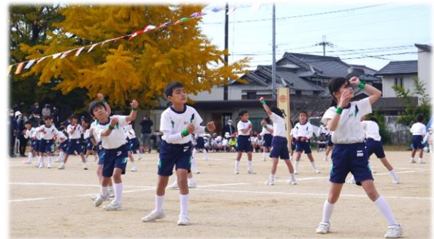
ハリハリでカッコいい低学年のダンス