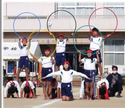
美しい五輪を表現した 高学年の 龍リニック 2021