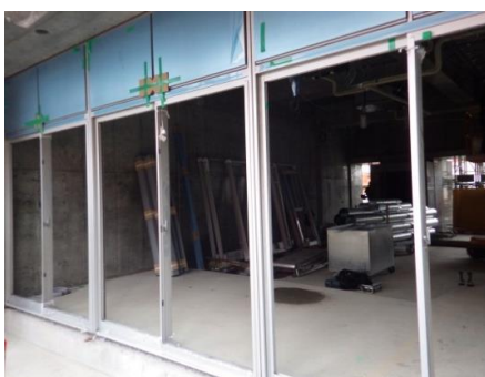
窓枠(サッシ)の取付