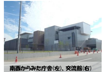
南西からみた庁舎(左)、交流館(右)