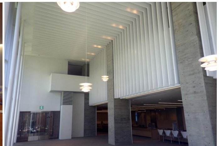
庁舎1階待ち合いロビー