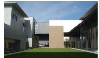
中庭から見た交流館(左)、庁舎(右)