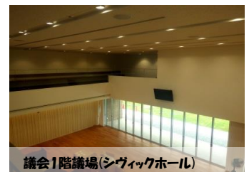
議会1階議場(シビックホール)