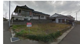
鹿児島県いちき串木野市(土地) 譲渡額約350万円