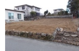
三重県津市(土地) 譲渡額約270万円