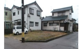
新潟県燕市(土地) 譲渡額約350万円