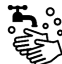
石けんによる 手洗い